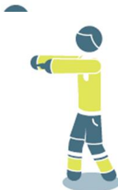
Удар от ворот