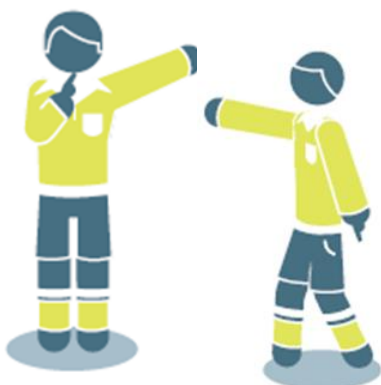
Удар от ворот